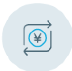
自分名義の他行口座へ振替