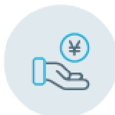
友達との食事代を割り勘