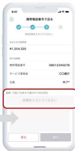
金額を入力し送金