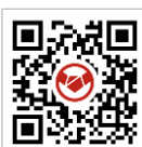
エンニチ 特集ページ